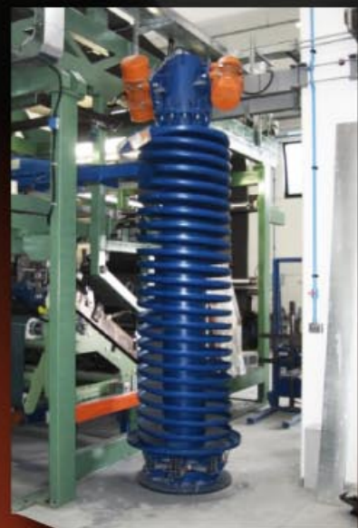
Elevatore vibrante a spirale