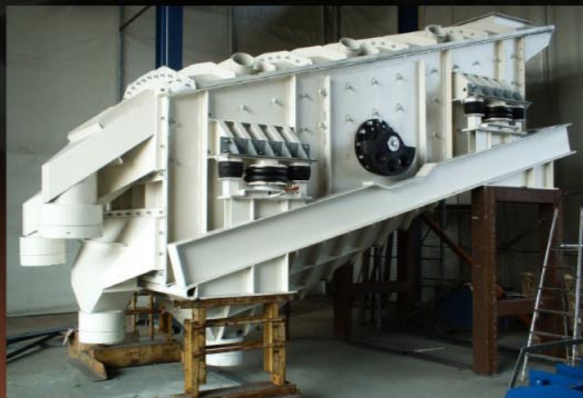
Vibrovaglio a 4 selezioni